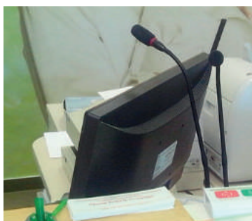
Установка микрофона на рабочем месте сотрудника

В записях автоматически производится поиск и подсчёт ключевых слов и фраз, входящих в скрипт соответствующей услуги, оказываемой клиенту. Для каждой фонограммы вычисляется итоговый бал, характеризующий степень соответствия процедуры обслуживания требованиям стандартов сервиса и техники продаж.